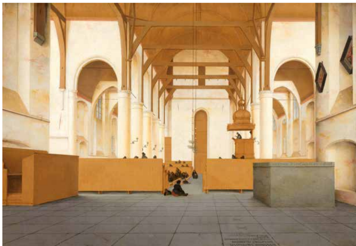
Pieter Jansz Saenredam, 'Interieur van de Sint-Odulphuskerk in Assendelft', 1649, Rijksmuseum Amsterdam