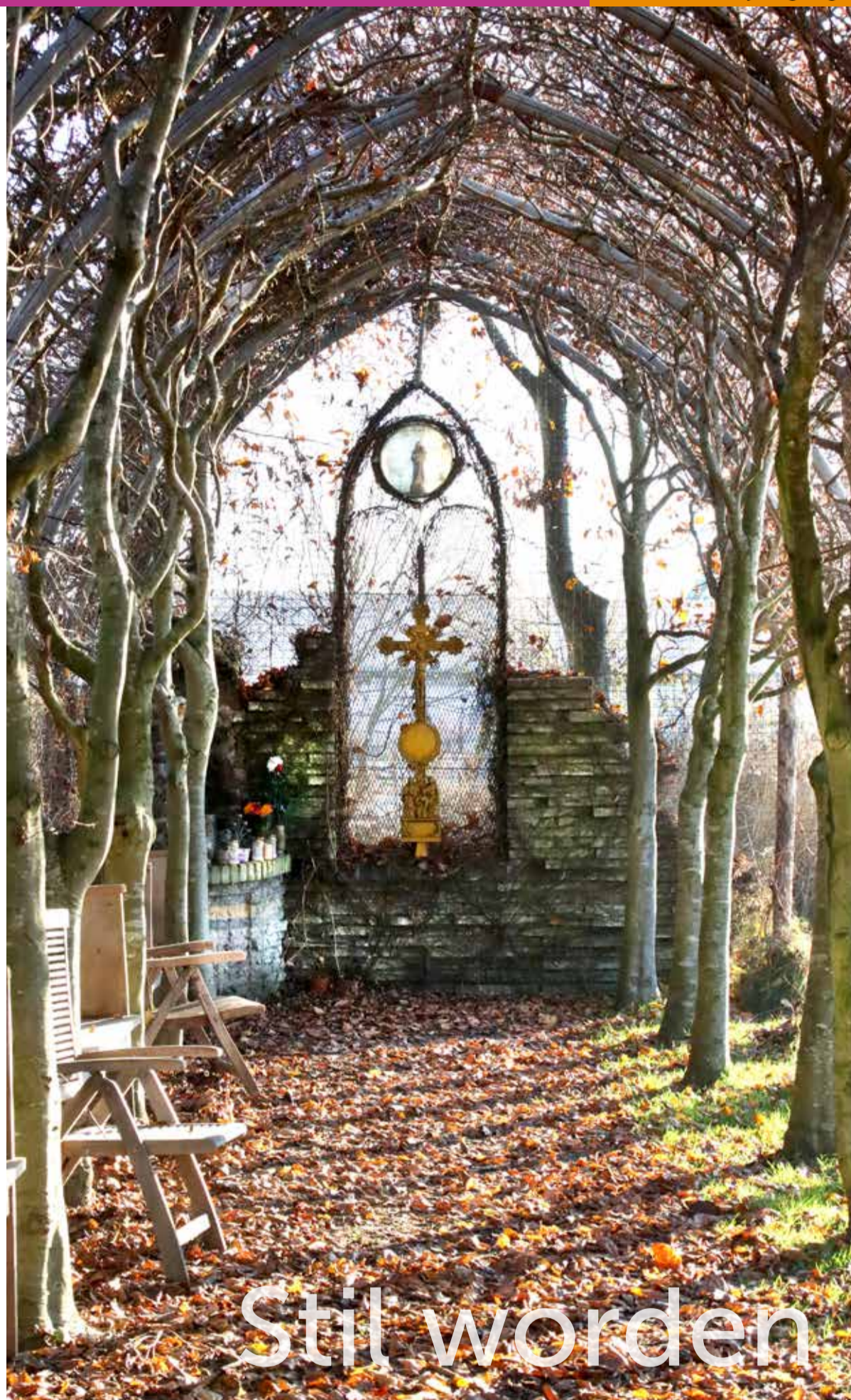
Groene kathedraal bij Hazerswoude

Vele bekenden en onbekenden gingen ons hierin voor. Sla er de Bijbel maar op na! In de nachtelijke stilte droomt Jakob zijn droom in Bethel, maar worstelt hij later ook met de Heer bij Pniël. In de immense leegte van de woestijn ontmoet Elia God: niet in een razende storm maar in het suizen van de stilte. In de stilte ervaart Job de ware troost van zijn zwijgende vrienden. Stil zijn kan dus overal: eenzaam in de nacht of in de natuur, maar ook samen met anderen kun je in stilte Gods nabijheid zoeken. De stilte geeft rust, maar ook ruimte voor strijd en klagen.