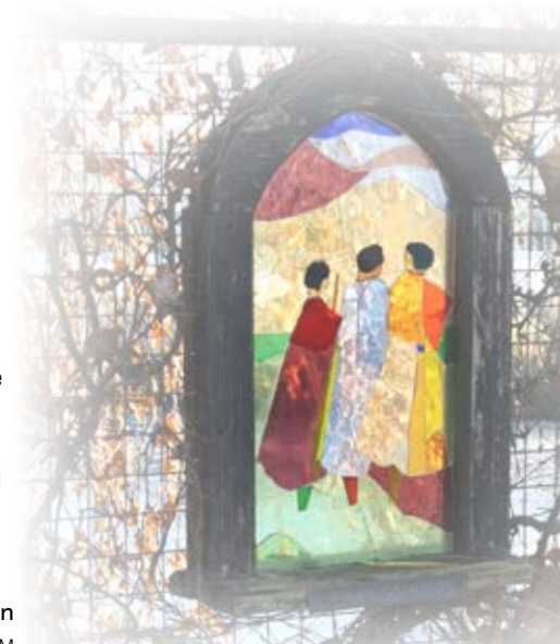
'Emmaüsgangers' (Lucas 24), Groene kathedraal bij Hazerswoude

Elke vrijdag om 10.30 uur vanaf De Balijhoeve, Kurkhout 100 in Rokkeveen W depelgrimzoetermeer.nl W protestantsekerk.nl/idee/emmauswandeling